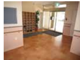
明るいエントランス

【おすすめポイント】 1階は、ディケア・クリニックが開業します。 周辺は、天王寺区役所、天王寺警察、大阪警察病院、四天王寺、コンビニ、スーパーライフ10分以内にありませう。 食事は、1食単位の注文も出来ませう。