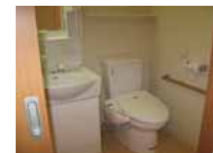
Aタイプの内部写真