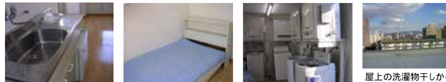
屋上の洗濯物干しから見える景色です。

【おすすめポイント】 徒歩10分圏内にスーパー・診療所(内科・外科・歯科)・総合病院が揃っています。 管理人が24時間常駐しています。 ベッド・テレビが付いてこのお家賃です！福祉・生活保護の方、外国籍の方も入居相談できます。